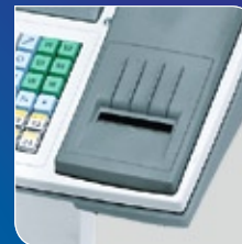
Bon- oder Etiketten-Druck