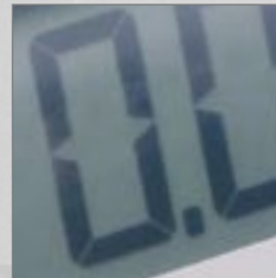
14-Segment-LCD- Gewichts- und Textanzeige